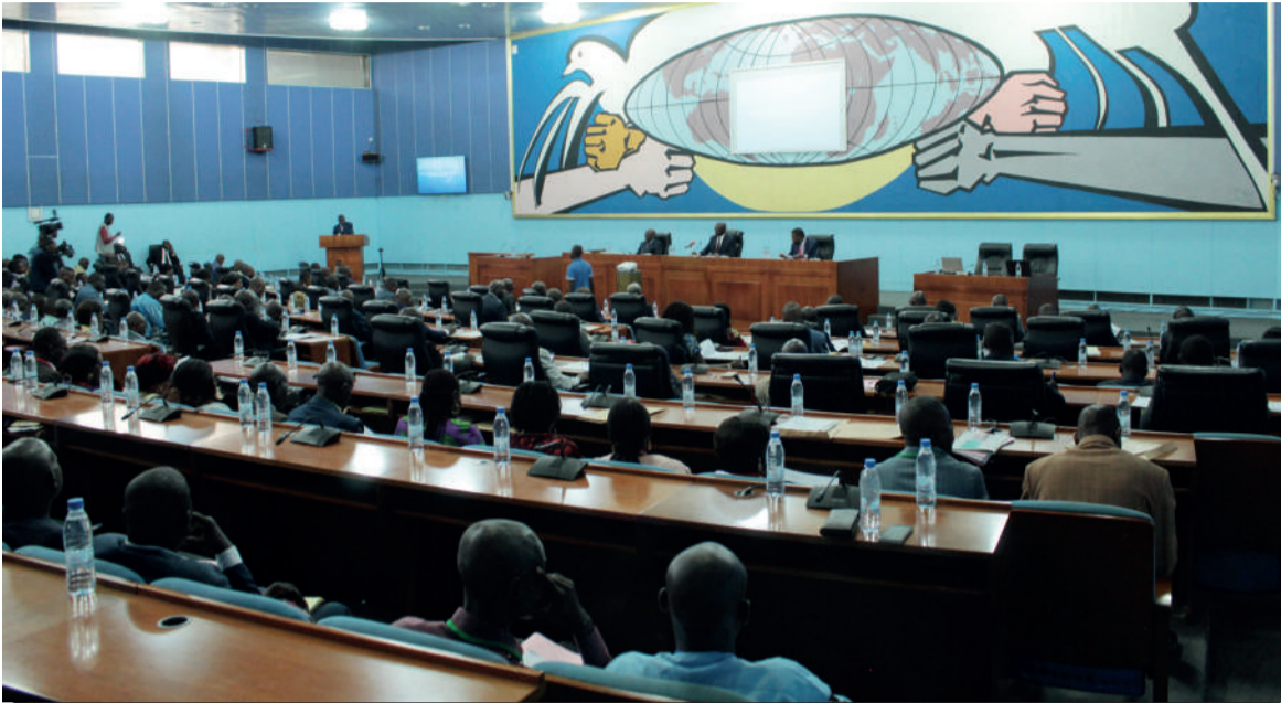
Les participants au 3 e Forum de l'agriculture, l'élevage et de la pêche