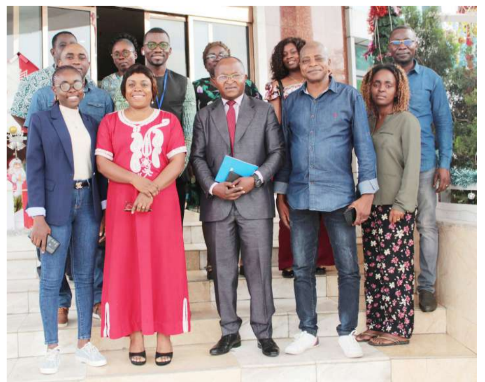
Les participants à l'atelier SIG