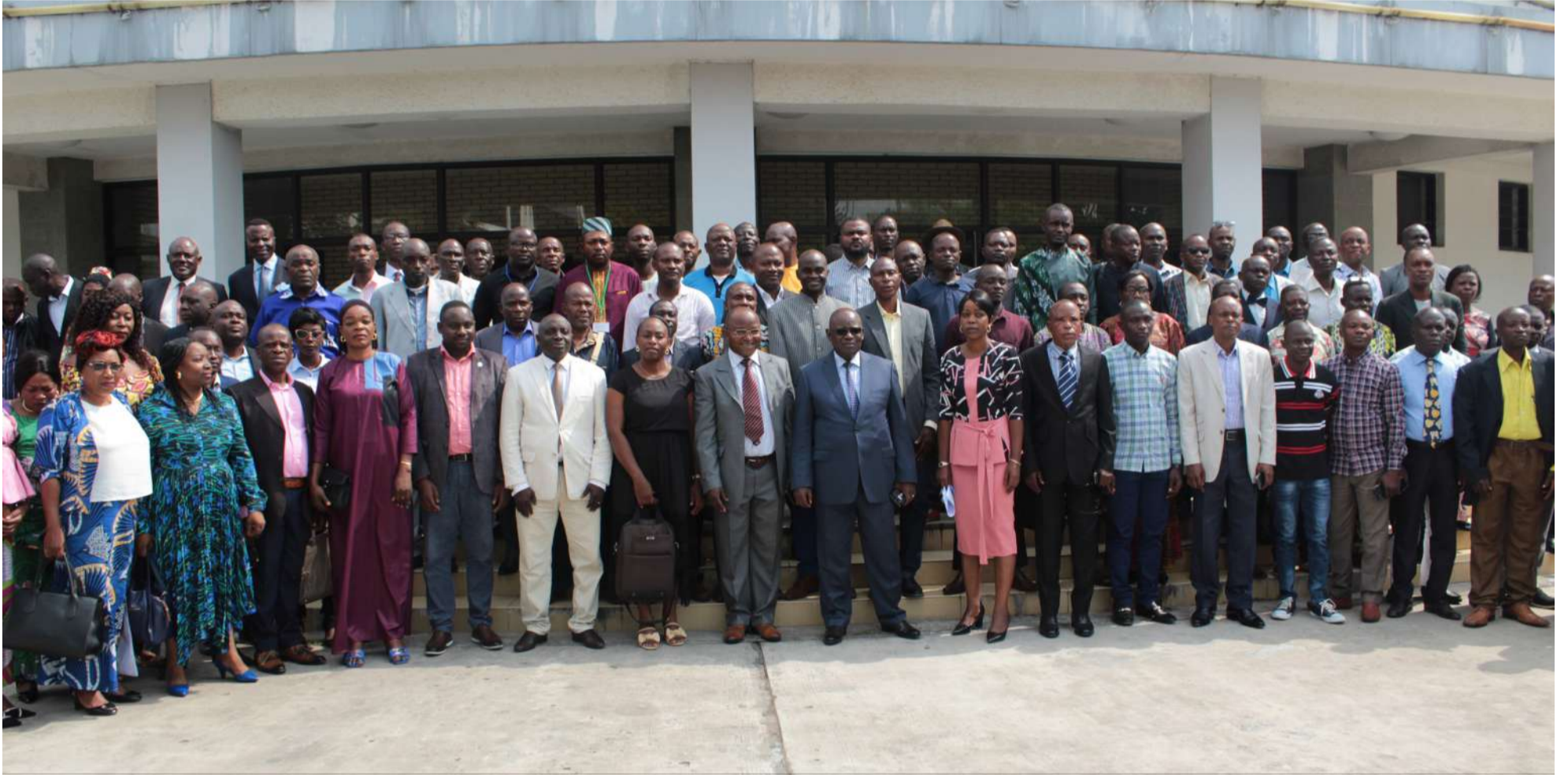
Le Directeur de Cabinet du ministre de l'Agriculture et les participants à la réunion des services déconcentrés sur la pérennisation des activités du PDAC

A USSITÔT APRÈS LE 3 E FORUM DE L'AGRICULTURE, DE L'ÉLEVAGE ET DE LA PÊCHE TENU À BRAZZAVILLE, LE 8 JANVIER 2023, les chefs de secteurs agricoles et les directeurs départementaux de l'agriculture, de l'élevage et de la pêche ont échangé avec l'Unité Nationale de Coordination du PDAC sur la pérennisation des activités de toutes les composantes, à l'auditorium du Ministère des Affaires Etrangères et des Congolais de l'Etranger, le 10 janvier 2023. A moins d'une année de sa clôture, le PDAC qui a délivré des résultats intéressants et dont l'impact est de plus en plus visible dans les districts, se préoccupe de ce que deviendront ses bénéficiaires au-delà de sa date de clôture prévue le 31 décembre 2023. Il s'est agi principalement du suivi des activités mises en œuvre par les ac-