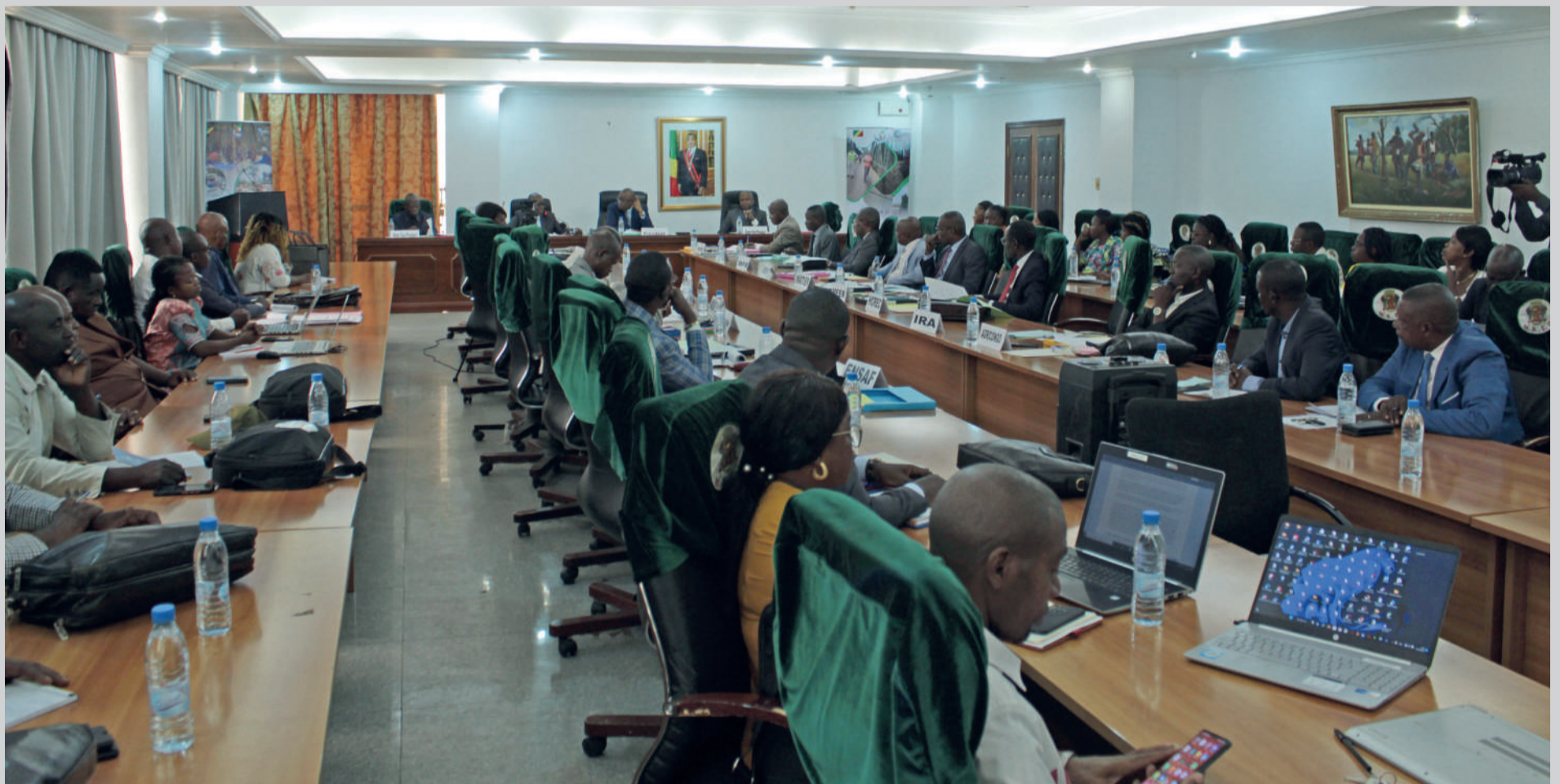
Les participants au Comité de pilotage du PDAC

L ES MEMBRES DU COMITÉ DE PILOTAGE DU PDAC se sont réunis en session ordinaire, le 27 décembre 2022, dans la salle polyvalente du 5 e étage du Ministère des Affaires Etrangères et des Congolais de l'Étranger, à Brazzaville. Cette 9 e réunion du Comité de Pilotage a adopté le rapport d'activités de l'année 2022 et le plan de travail et budget annuel de l'année 2023. Il ressort de l'examen du rapport d'activités de l'année 2022 que l'ensemble des activités prévues ont été exécutées, notamment les pistes de desserte rurale, en mode mécanisé et en HIMO, l'électrification des bassins de production dont les travaux sont presque achevés, le financement des plans d'affaires et particulièrement les plans d'affaires de consolidation, le renforcement des capacités des administrations