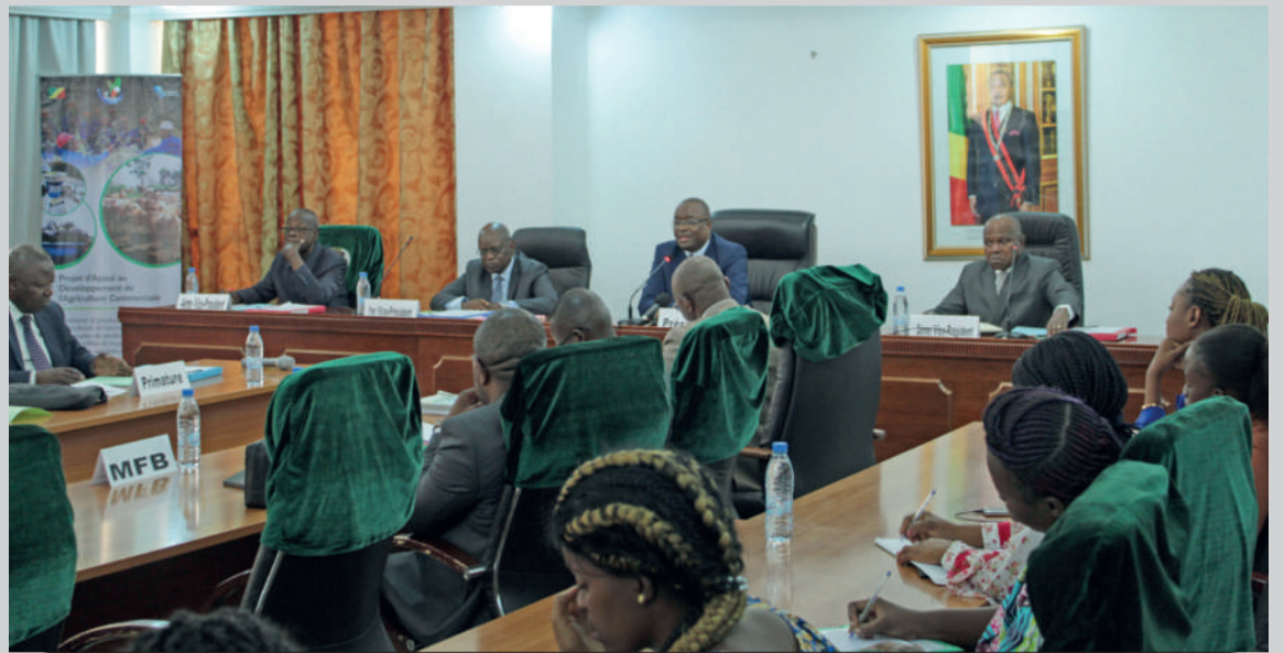
Les membres du Comité de pilotage du PDAC